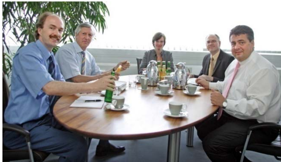
B.A.U.M.-Vorstand bei Bundesminister Sigmar Gabriel in Berlin