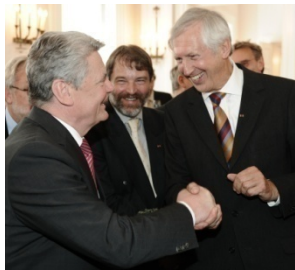
Bundespräsident Joachim Gauck empfängt B.A.U.M. in Schloss Bellevue