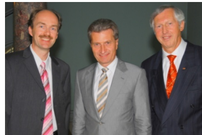
Günther Oettinger, damals Ministerpräsident von Baden-Württemberg, bei der B.A.U.M.-Jahrestagung