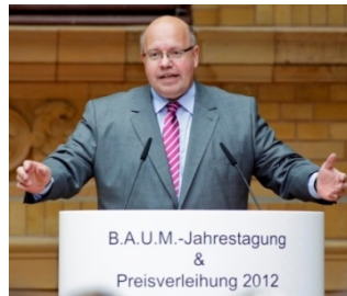
Bundesminister Dr. Peter Altmaier bei der B.A.U.M.-Jahrestagung